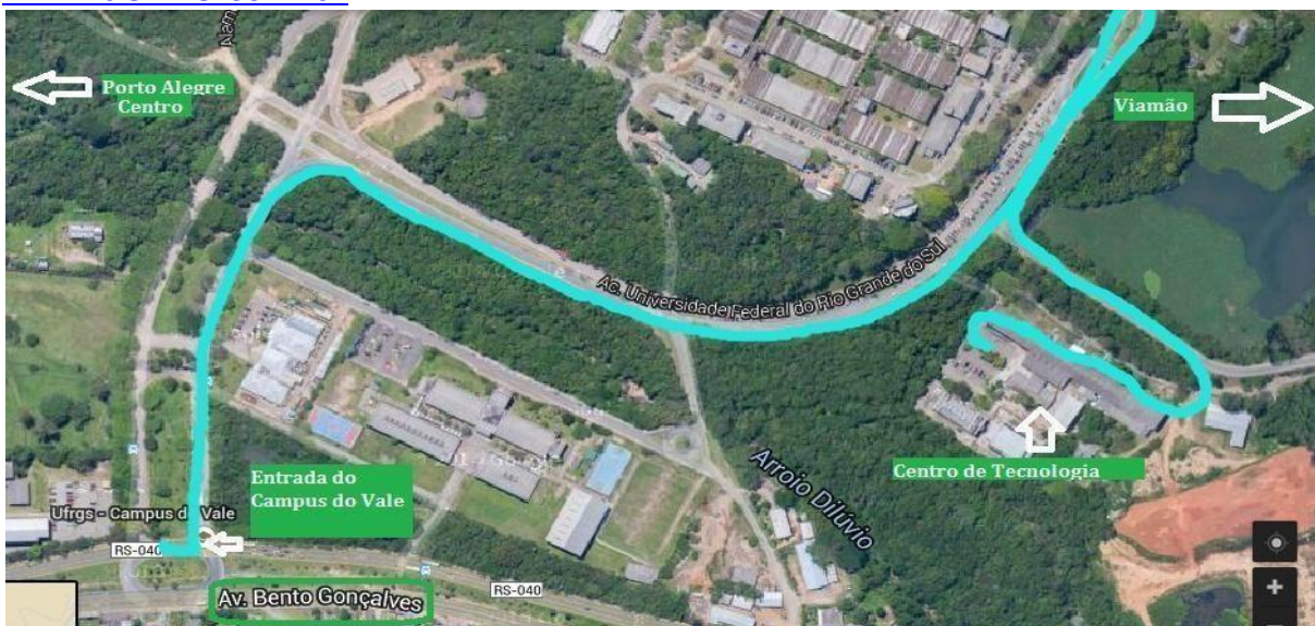
Mapa do Centro de Tecnologia da UFRGS. Local de Trabalho do Grupo CBCM.